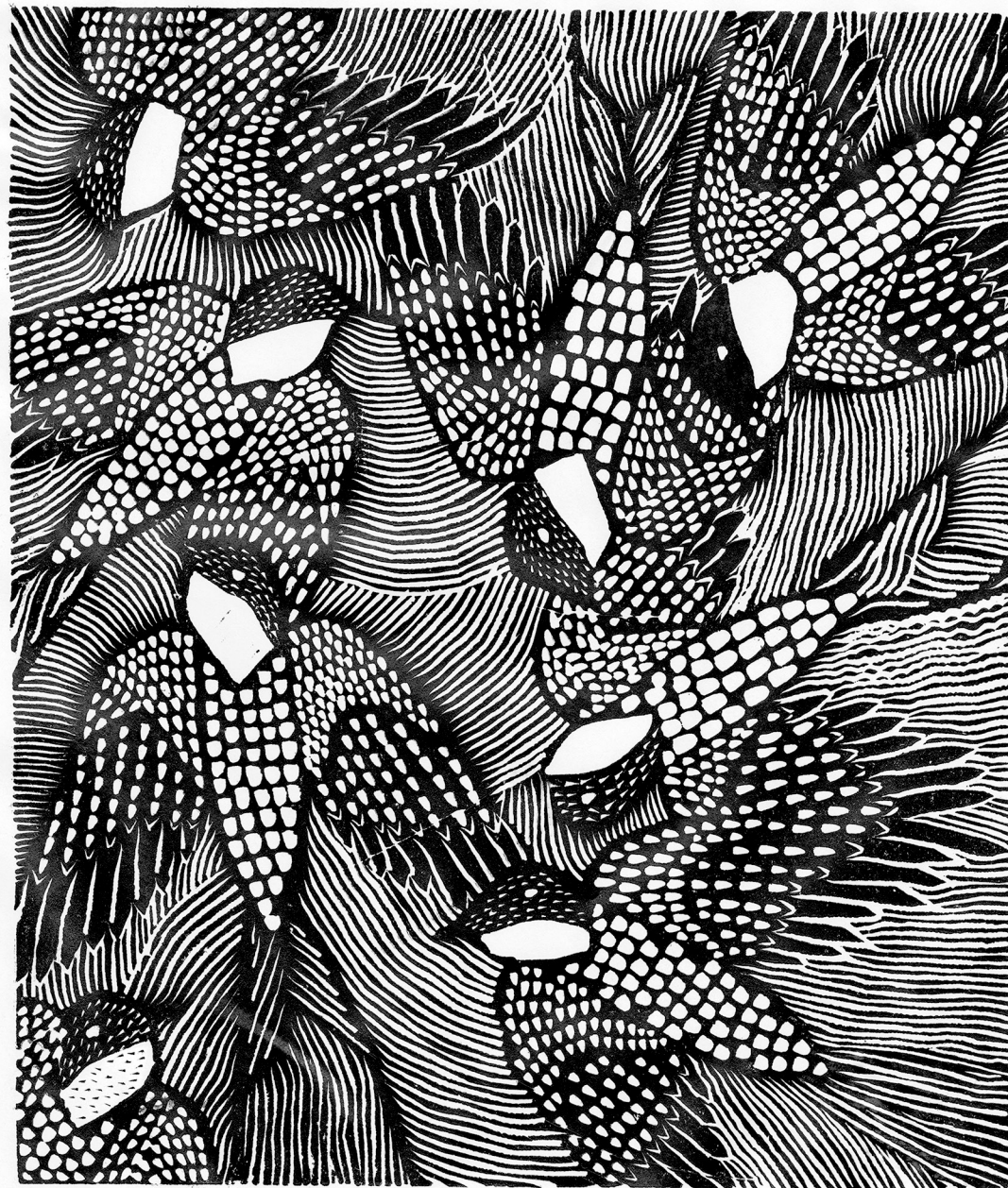
Cinoryst Marek Suorkot Kukle'19